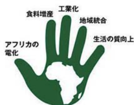
[AfDB's High 5s]

「アフリカの人々の生活の質向上ボンド」は、アフリカ開発銀行が注力する5つの分野「High 5s」の中の1つであり、インフラ整備や水・衛生保健分野での基礎サービスへのアクセス改善、人材育成等を通じ、若年層を含めた雇用創出を目指すものです。アフリカ開発銀行の発行する本債券を通じてこのプロジェクトに寄与することが出来ます。アフリカ開発銀行は、この債券発行による調達資金または同額以上を当プロジェクトに充当すべく最大限の努力を致します。