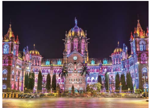
チャトラパティ・シヴァージー・ターミナス駅